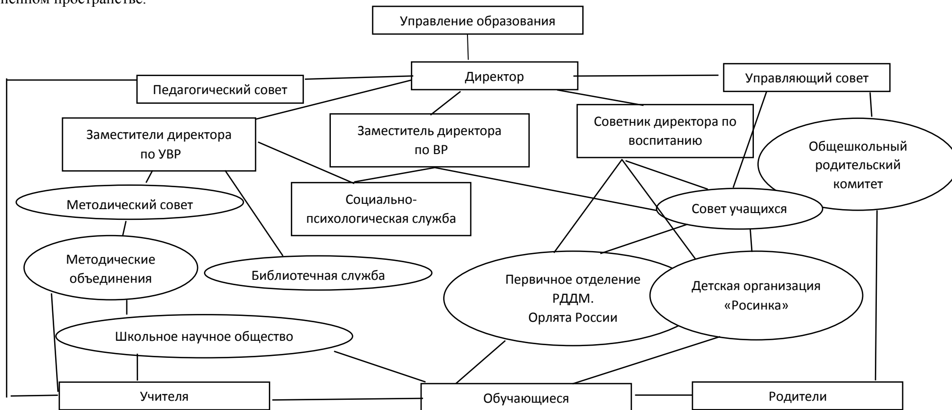
Рис. Структура управления образовательной деятельностью

В школе работает социально-психологическая служба. Её цель - создать благоприятные условия для развития личности ребенка в семье и школе, оказать комплексную помощь по саморазвитию и самореализации в процессе восприятия мира и адаптации в нем, защитить ребенка в его жизненном пространстве.